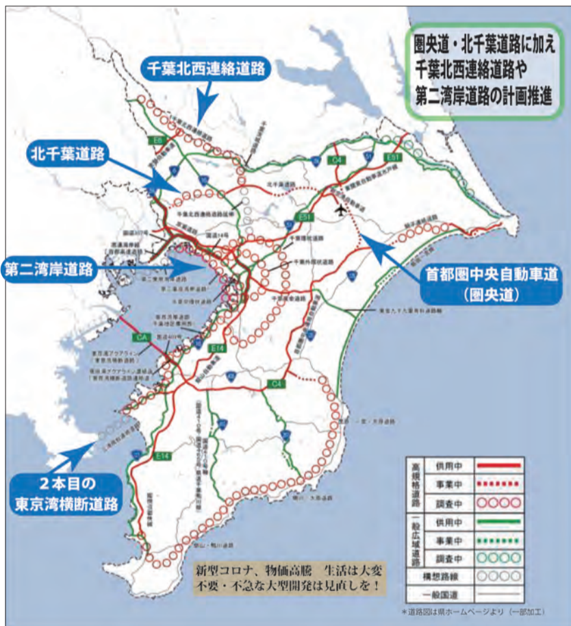
広域道路ネットワーク図（「千葉県広域道路交通ビジョン」より）

県は、北千葉道路や千葉北西道路、圏央道につづき、沿線6市と「新湾岸道路整備促進期成同盟」を設立し、5月に国へ早期実現を要望しました。三番瀬の貴重な自然の保全と両立しない道路は認められません。さらに東京湾アクアラインのトンネルをもう1本掘り、4車線から6車線化を検討するとしています。渋滞緩和などを理由にあげますが、莫大な建設費は、国民の苦しい生活に回すべきです。