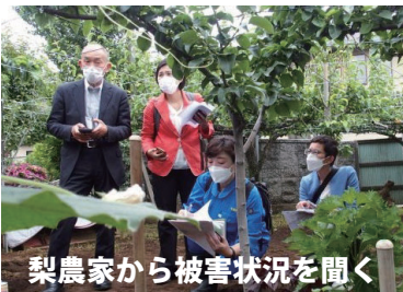
梨農家から被害状況を聞く

県の特産品の梨は、通常、高値で取引されますが、傷ついた梨は、ランクが下がり、農家は減収となります。県は、今後の生育状況のみを、販売促進などに力を入れると述べました。