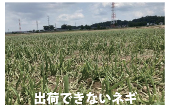
出荷できないネギ