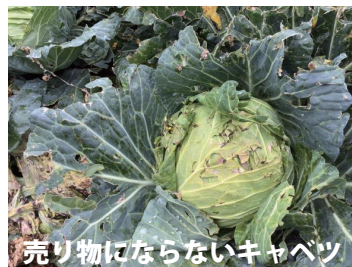
売り物にならないキャベツ