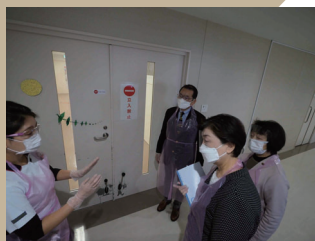
県に要請 (11/4) 生活と健康を守る会