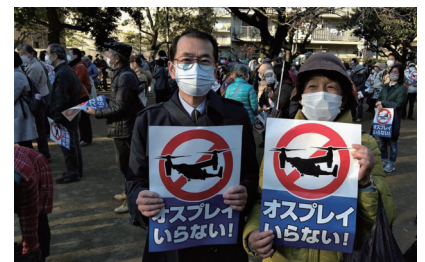
12月4日、船橋市薬円台公園で開かれた集会

今月1日、館山基地に米空軍オスプレイが緊急着陸しました。木更津に配備されている陸自オスプレイは木更津、館山、茨城県百里、東富士、群馬県相馬が原で訓練するなど、首都圏の空を飛行し、住民は事故の危険や騒音被害にさらされています。