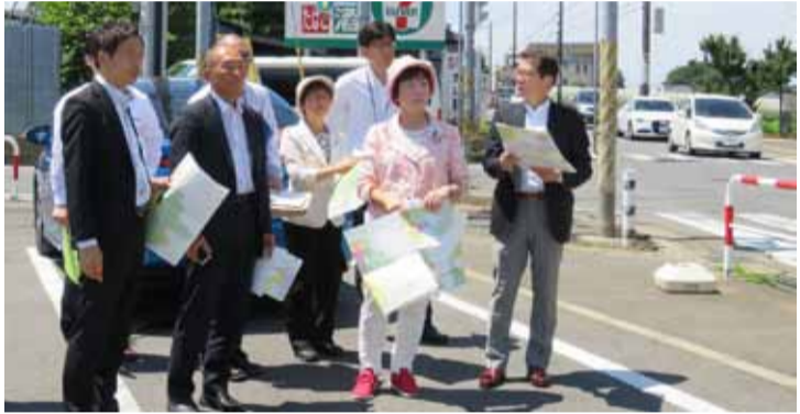
北千葉道路建設予定地を視察

圏央道、北千葉道路など巨大大道建設につぎ込むお金は3500億円。1兆円規模の第二湾岸道路の復活を狙っています。水余り、洪水対策に効果がないハッチダム県の負担は464億円です。