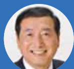
市議会議員 やざわ英雄