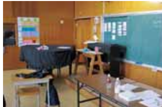
教室不足で音楽室を普通教室に転用。ピアノはそのままです。

小・中学校、県立高校では考えられないような過密化・教室不足が放置されてしまうのは、特別支援学校の「設置基準」が、国にも県にもないからです。そのため、教室の面積もバラバラ、音楽室など特別教室がなくなつても、問題にもならないのです。共産党は、設置基準が必